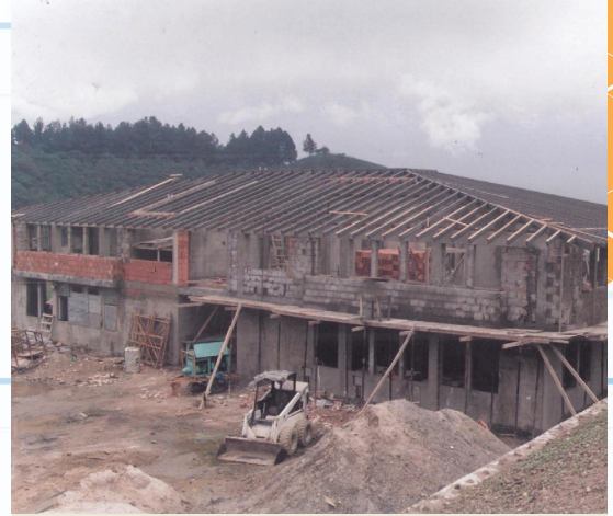
Construcción de la sede de Fundacite Mérida