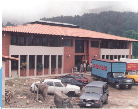
Mudanza a la nueva sede