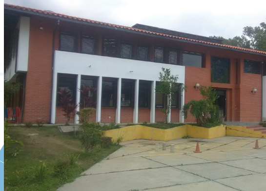
Fundacite Mérida ente rector de Ciencia y Tecnología del estado Bolivariano de Mérida.

como la era de la actualidad institucional, marcada por su orientación hacia la gestión social, en la que Fundacite Mérida se involucra directamente en el acompañamiento y desarrollo de distintos proyectos de carácter socio-productivo, mediante la creación de las llamadas Redes Socialistas de Innovación Productiva, sincronizado con el Plan de la Patria, erigiéndose como el ente rector de ciencia y tecnología en la entidad.