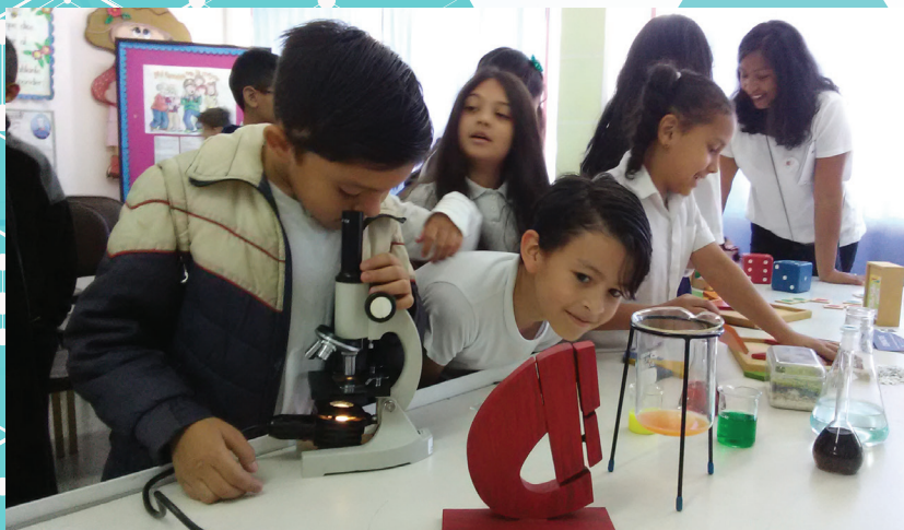
“Casa de los saberes” espacios para el fomento de la ciencia y la tecnología

que deseen formarse profesionalmente en el mundo de la ciencia y la tecnología, indica Mercado.