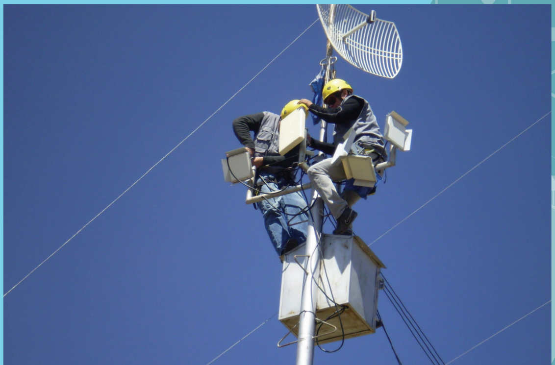
Nuevos proyectos para la RISEM.