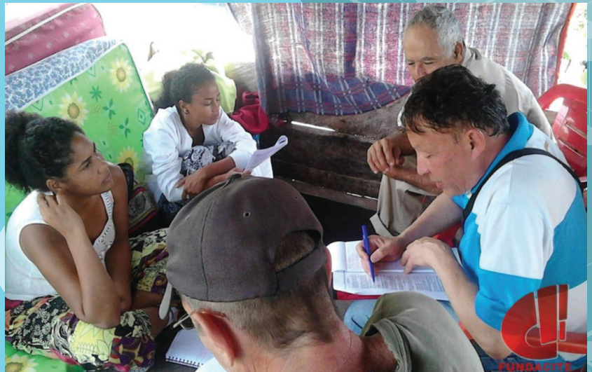
Asistencia técnica a las redes socialista de innovación productiva

En este mismo sentido, será valiosa la data que se obtendrá con el Registro Nacional de Investigadores e Innovadores, abierto por el Observatorio Nacional de Ciencia y Tecnología, para identificar las capacidades y el potencial meridiano en esta materia.