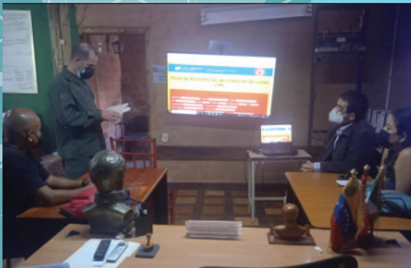
Foros en línea y presenciales permiten el intercambio de conocimiento.