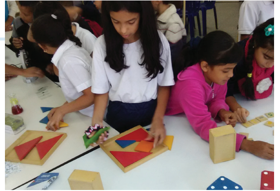
La interacción con la ciencia despierta el interés en los participantes

Es así como el programa “Casa de los Saberes”, ha adquirido una nueva plataforma de impulso acorde con las nuevas tecnologías, dirigido a despertar el interés científico en las niñas, niños, jóvenes y adultos, para realizar una captación de aquellos