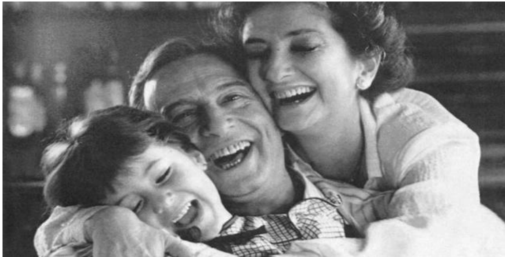
Fotograma de La Historia Oficial . Familia aparentemente nuclear

los años cincuenta y sesenta. Un país como Argentina, recién salida de la dictadura, revelará magníficas producciones fílmicas sobre su reciente memoria histórica. Así, tras la llegada de la democracia con Raúl Alfonsín, se comenzó a asumir el trauma sufrido en la última dictadura o “proceso de reorganización nacional” (1976-1983), surgiendo un cine de denuncia, cuyo objetivo primordial fue narrar el dolor, el testimonio cruel, que significó para muchos la tortura y el “secuestro”.