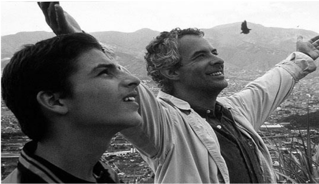
Fotograma de La Virgen de los sicarios . Nuevas formas de amor y familia.

Y por último como colofón al siglo XX un director iraní, Barbet Schroeder, formado en el cine francés de la “nouvelle vague” realizó en Colombia con actores colombianos La Virgen de los sicarios (1999) 25 , basada en la novela homónima de Fernando Vallejo. Es una historia de desarraigo, soledad, amistad y amor “prohibido”. En cuanto a los personajes hay que decir que al igual que ocurre en La vendedora de rosas , la película cuenta con un plantel de actores no profesionales, que en la vida real se dedicaban a la misma actividad que desarrollan en la ficción: “Sicarios”. Esta fue una de las razones que provocó el descontento de las autoridades hacia el film de Schroeder.