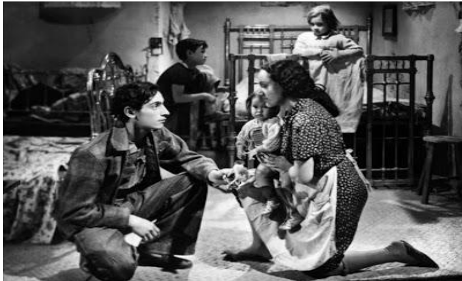
Fotograma de Los Olvidados ejemplo de familia monoparental extensa

También encontramos el arquetipo de familia monoparental (monomarental) constituida por la madre de familia y los hijos, mujer que lleva la carga familiar sola, cansada y agobiada por el peso de los días, limpiando casas ajenas para desarrollar la función de proveedora de una familia numerosa, formada por 4 hijos de padres distintos, lo que define a su núcleo familiar en monoparental extendido. Esta mujer, cuando era casi una niña, fue violada y abandonada a su suerte, fruto de esa circunstancia es su hijo mayor, Pedro, no querido porque encarna la agresión que ella recibió. La que un día fue víctima, y sigue siéndolo en muchos aspectos de su vida, genera por su falta de cariño e indiferencia el trágico destino de su hijo, Pedro, que busca el afecto que le es negado en los sueños, donde sublima a su madre entre la mística y la erótica; y, por otro lado, el hijo abandonado (desolado), ante la humana necesidad de pertenencia a un grupo, buscará el reconocimiento e identidad en redes sociales pandilleras, excluidas y marginales que disfrutan extorsionando el “orden social” del que están excluidos.