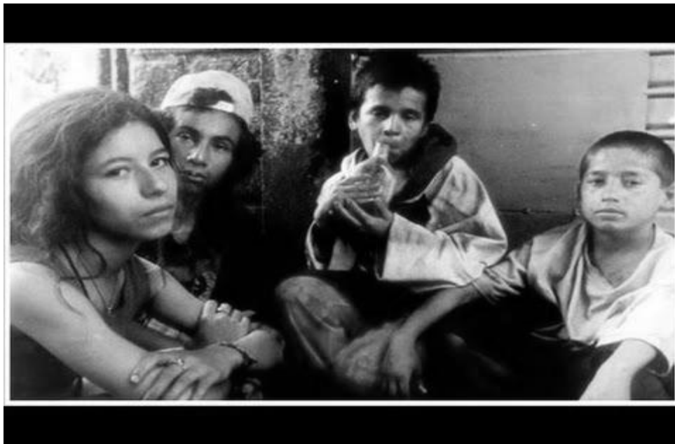
Fotograma de La vendedora de rosas . La pandilla o red social primaria como signo de pertenencia e identidad

misma soledad de todos los días, a la pobreza, a la droga y a la muerte. La protagonista ha creado su mundo en las calles de esta ciudad latinoamericana en la que lucha y se rebela por lo único que tiene: sus amigas, su novio y su dignidad. Los actores del film no son profesionales, por lo que el director tuvo que trasladarse con su equipo a las barriadas donde estas personas vivían. Permitiéndole así obtener una visión más justa de la realidad que quería ofrecernos, y aprovechando el ambiente que únicamente se encuentra allí: droga, música alegre y triste que se escucha en las barriadas populares de la ciudad de Medellín. Según declaraciones realizadas por el productor de la película (Erwin Goggel): "...tuvimos que invertir enormes toneladas de paciencia. Para empezar, no es la clase de película en la que uno pueda definir sobre el papel cuántos días de rodaje necesita, porque trabajar con actores naturales, niños que viven en la calle, es totalmente imprevisible. Ni ellos mismos saben cómo van a estar dentro de diez minutos" 23 .