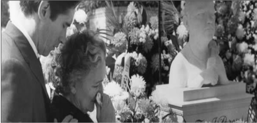
Fotograma de Muerte de un burócrata . Ejemplo de familia extensa tercer grado de consanguinidad

trámites burocráticos para poder cobrar su pensión de viudedad, ella siempre ha estado relegada al papel de “ama de casa” y a la tradicional división de roles entre hombre y mujer: el hombre es el encargado de resolver los asuntos públicos, y en este caso le tocará a su sobrino tomar el rol de enfrentarse a lo público y a la sinrazón de la burocracia.