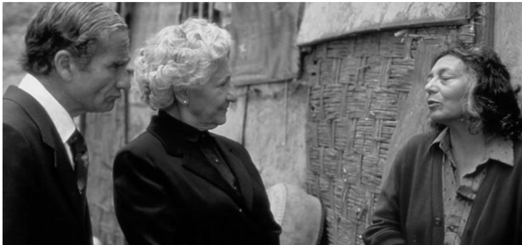
Fotograma de la película Caídos del Cielo . Los oligarcas decadentes y marginalidad

únicos ingresos consisten en la recaudación de los alquileres de unos inquilinos que, en la mayoría de los casos, no tienen con qué pagarles.