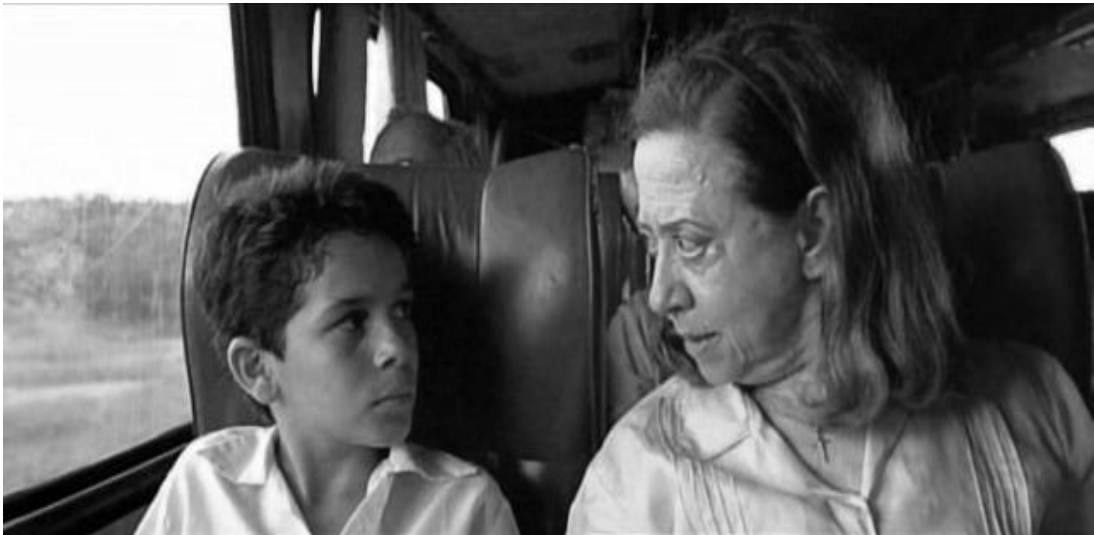
Fotograma de Estación Central Brasil . Padres ausentes y familia psíquica

Las circunstancias, no obstante, acabarán uniendo a Dora y Josué en un viaje rumbo al nordeste, " otro planeta " según las palabras de Dora, lo que nos sitúa ante la inmensidad de un país de grandes contrastes como Brasil. Poco a poco, kilómetro a kilómetro, iremos conociendo a Dora, Josué y la intrahistoria de un Brasil que escapa a los grandes tópicos turísticos que existen sobre el mismo. El film nos traza un verdadero viaje hacia la autenticidad, un viaje casi iniciático.