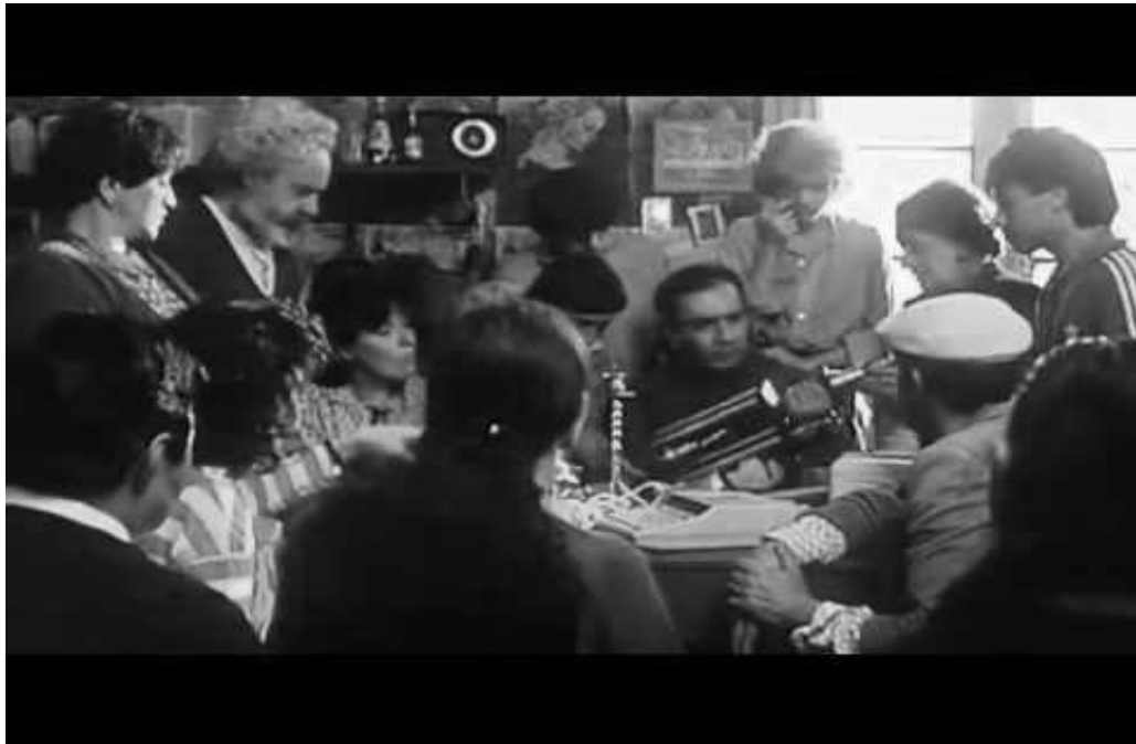
Fotograma de La Estrategia del Caracol , representativa de la importancia de las redes sociales primarias, basadas en la vecindad

Para ello llevan a la práctica lo que denominan “la estrategia del caracol”: si la casa no va a ser para ellos no será para nadie, por lo que proceden a desmontarla y llevársela a escondidas hasta un solar en las afueras de la ciudad, adquirido de forma colectiva. Como los caracoles, se irán con la casa a cuestas. Como indica el personaje que asume el rol de narrador: “ hasta los más enviciados empezaron a meterle amor a la estrategia ”, convirtiéndose ésta en una actividad que transforma y dignifica a quienes participan en ella.