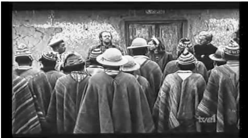
Fotograma de Yawar Malku : Los hombres de la comunidad indígena frente a los gringos

En 1969, Jorge Sanjinés, con su película Yawar Malku , film entre la ficción y el documental nos refiere la intromisión del imperialismo en el control de natalidad de las comunidades indígenas, intromisión planificada por la “Alianza para el Progreso”, y que se tradujo como un auténtico genocidio materializado en la esterilización de las mujeres indígenas.