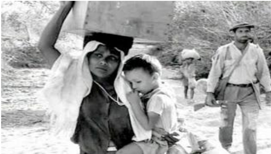
Fotograma película Vidas Secas . Ejemplo de familiar nuclear

En 1963 Nelson Pereira dos Santos 5 , uno de los padres del “Cinema Nôvo” brasileño, adaptó la novela Vidas Secas de Graciliano Ramos 6 a la película a la que tituló igual y cuya acción transcurre en la década de los treinta y cuarenta del pasado siglo XX. En todo momento el film, fiel a la novela, pretende reflejar el éxodo migratorio de un medio rural inhóspito, concretamente de la región nordestina (Sertão), hacia la ciudad. A lo largo de la obra se plantea la universal alternativa entre dos mundos enfrentados: la “civilización”, simbolizada por la ciudad; y la “barbarie”, representada en el medio rural. La intención del director es, como bien se expone en el film, denunciar la situación de endémica pobreza y subdesarrollo del Brasil rural nordestino, del Sertão, como causas del secular trasiego humano hacia zonas urbanas costeras (San Salvador de Bahía o Río de Janeiro) que “ofrecen” más alternativas a la miseria humana. El período cronológico de la novela y del film se sitúa en la época del gobierno de Getulio Vargas 7 .