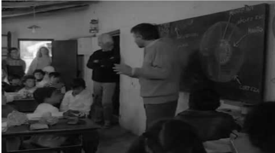
Fotograma de Un lugar en el mundo

El realizador argentino Adolfo Aristarain con Un lugar en el mundo (1992) 18 revela la emigración interior desde la “civilización” a la “barbarie”, éxodo emprendido por una burguesía porteña intelectual que fue víctima de la última dictadura, el eufemísticamente denominado “Proceso de Reorganización Nacional” llevado a cabo por la Junta Militar entre 1976 y 1982, “proceso” que tuvo el elevado coste humano de treinta mil desaparecidos.